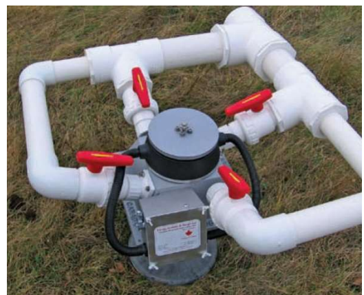
エナジー システム & デザイン社 ターゴ型、永久磁石利用、12/240VDC 1kW

しかし大抵の方々はその様な高出力の得られる環境に居住されているとは言えません。その場合低出力の DC を利用するしか方法はありません。通常 100W から 1,500W 程度が場所により異なりますが得られる範囲です。得られる DC を蓄電池充電に使用し DC-AC インバーターで家電製品を利用し、蓄電池群はその最大利用電気容量を満たす容量に設計されます。