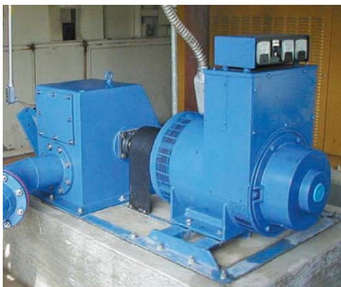
16kW キャニオンペルトン発電機 AC120/240V 発電で蓄電池やインバーター 不要

皆さんがマイクロ水力発電を計画される場合、一番最初に調査されるのは、ゴミを排除する取水方法であり、その後の導水管をどうすれば良いか等をお考えの筈です。同時に発電された電力を如何にロス無くしかも低価格で使用できるかも大きなトピックスと言えます。