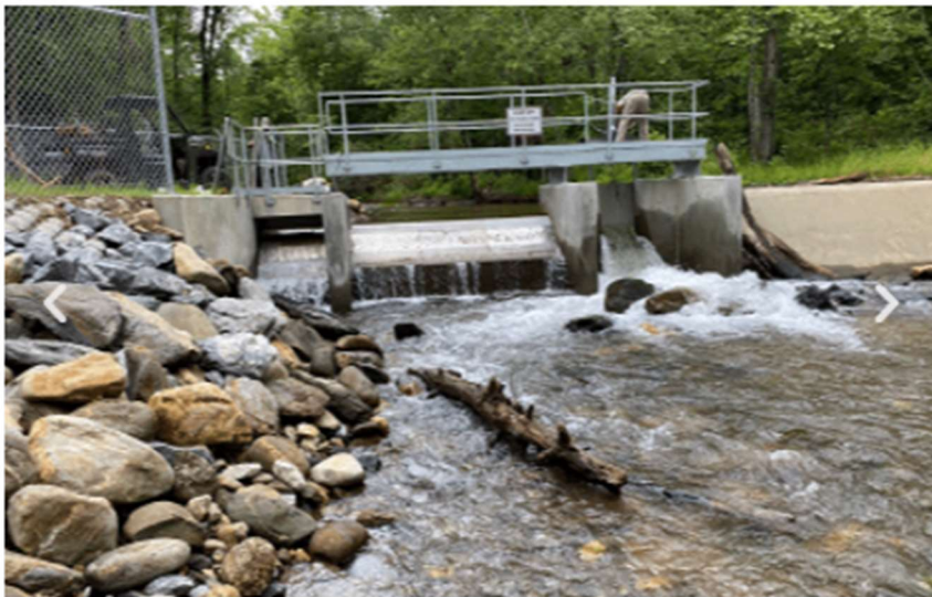
上の写真は、右端に魚道を設けた河川での利用例です

インドおよび南米地域（標高の最も高い地域）からは、0.1 または 0.2 mm の小さな粒子にコアンダを使用してほしいというよくあるリクエストがあります。しかしそのような小さな砂の除去には重力チャンバー(上流・下流の沈砂地)を使用することを常に推奨しています。